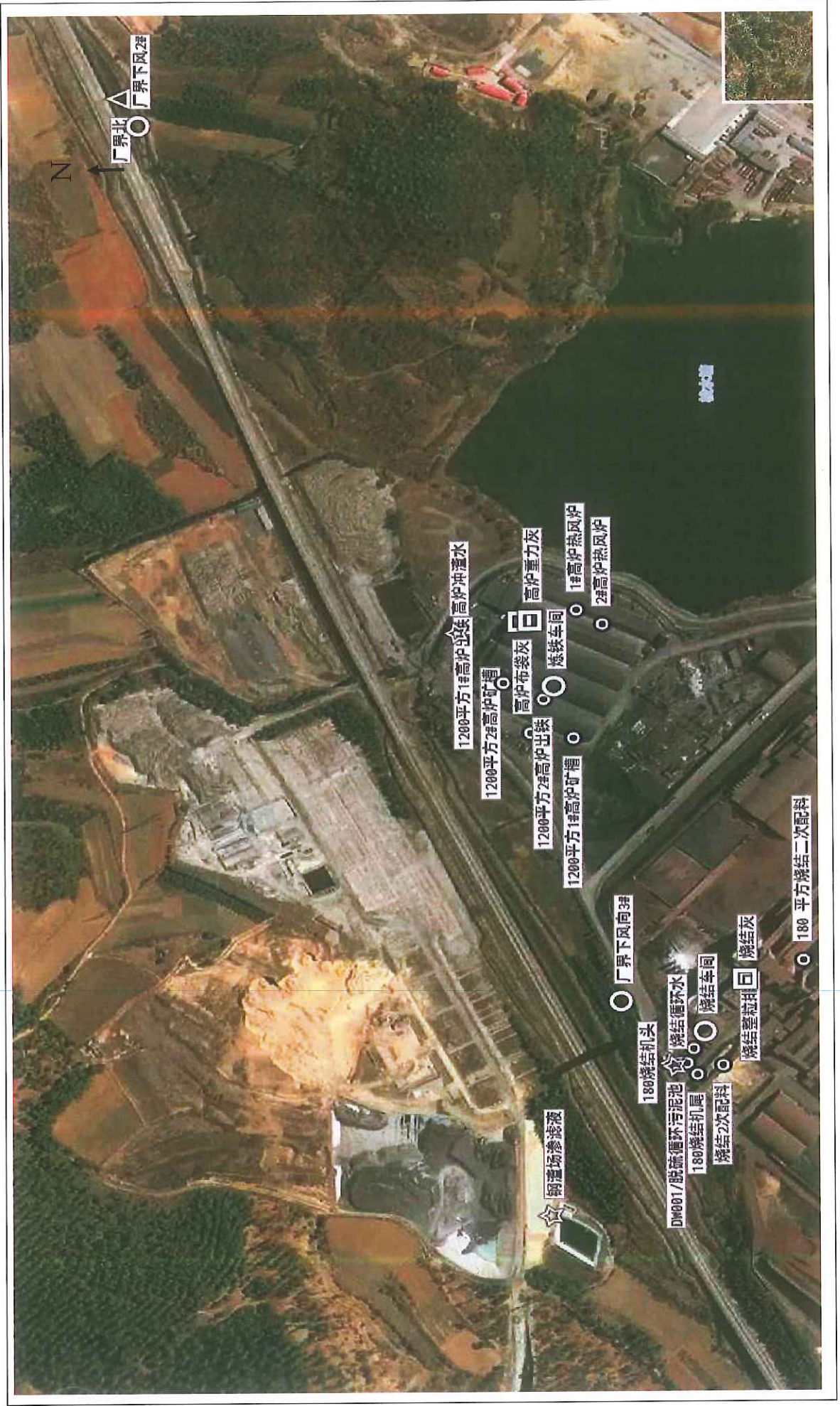
云南曲靖呈钢钢铁集团有限公司现场监测点位示意图