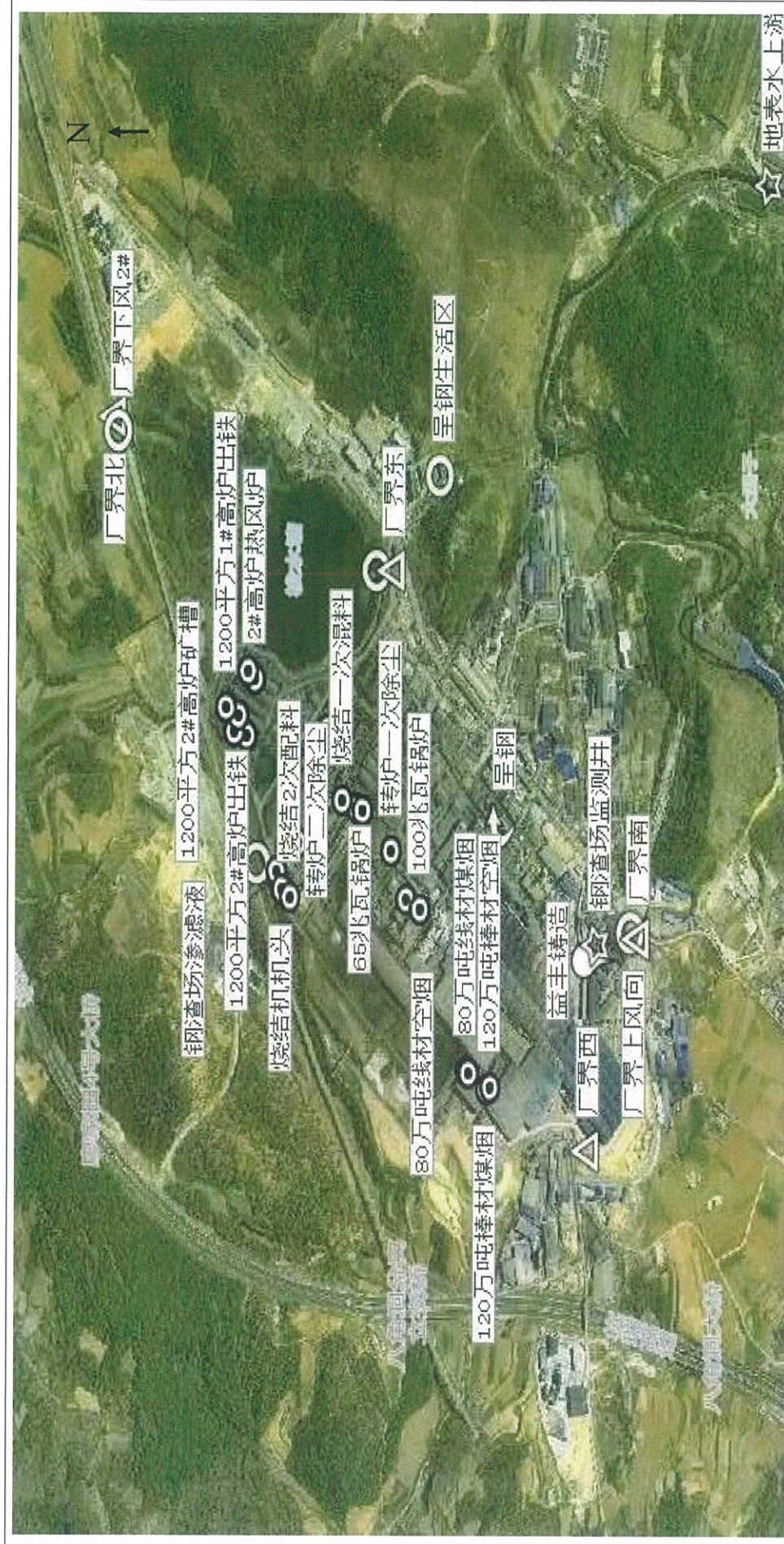
云南曲靖呈钢钢铁集团有限公司现场监测点位示意图